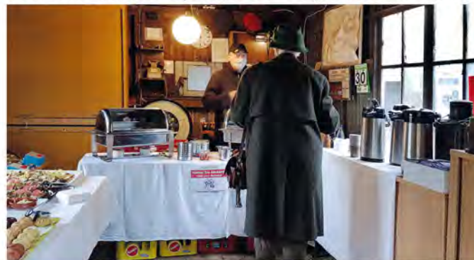
Catering im Wellblechbahnhof vom ANDERS-Hotel auf Bestellung

Mit Muskelkraft auf Deutschlands einziger Schmalspur-Fahrraddraisine die Kleinbahnstrecke mit fachkundiger Begleitung abfahren. Im Anschluß an eine Fahrt mit der Draisine kann an den Wochenenden ein Halt an dem Bahnhof Hollige eingelegt werden. Am deutschlandweit einzigen Wellblech-Bahnhof Hollige kann dann gepicknickt werden. Erleben Sie wie Gerhard Hauptmann's „Bahnwärter Thiel's“ Alltag war. Im Hofladen Produkte aus den Dörfern kaufen, in der alten Küche sitzen oder den Bahnhof besichtigen. Hasen, Hühner, Enten und Gänse laufen frei herum. Auf dem Freigelände bei einer Tasse Kaffee entspannen oder Mitgebrachtes verzehren.